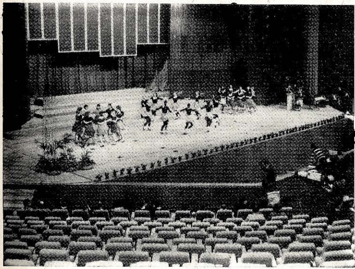
Kongresová hala a javisko nového domu ROH v Bratislave.