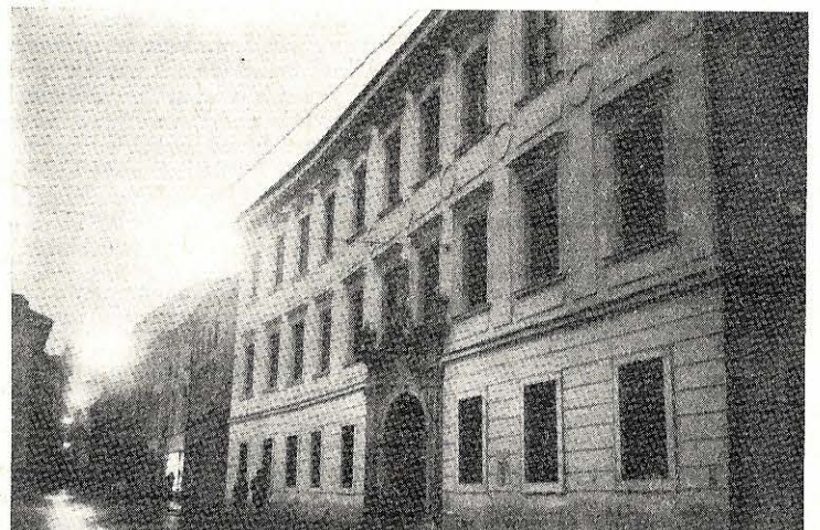
Pohľad na priečelie zrenovovaného pálfyovského paláca na Jiráskovej ulici v Bratislave, na ktorom je pamätná tabuľa W. A. Mozarta.